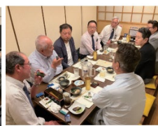
活動報告会後の懇親会